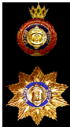
L'Ordine Dinastico Sri Sakimat Makhapraphulla di Jhalavad