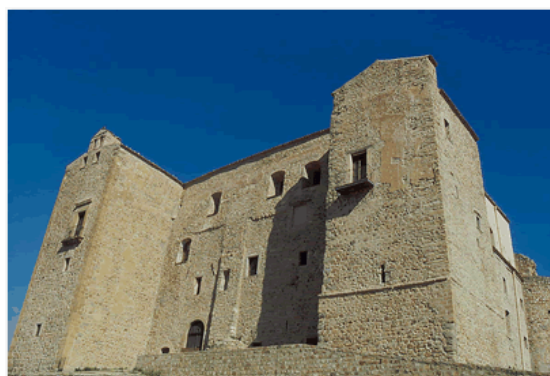
Castello Ventimiglia a Castelbuono

finanziarie del sovrano sia con prestiti, sia con cessione di grano, sia rinunciandogli introiti derivategli dalle rendite vitalizie che il re gli aveva concesso sui caricatori di Tusa e Soltanto.