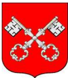
Arma di Clermont S.t Jean: Di rosso a due chiavi d'argento decusse