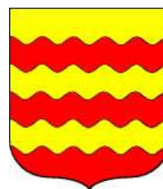
Arma Garretti: D'oro, a quattro fasce ondate nebulose di rosso