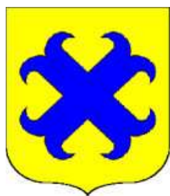
Arma Broglia: D'oro al decusse d'azzurro ancorato