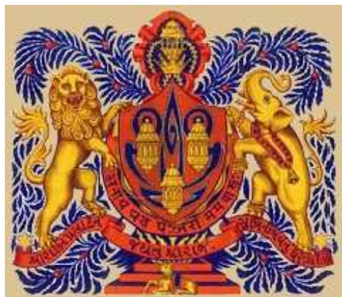
Arma dello Stato di Dhrangadhra-Halvad

Nel 1947 il Maragià di Dhrangadhra-Halvad arrivò in Inghilterra per l'ultima lettura della proposta di legge per l'Indipendenza dell'India e per un'udienza privata col ultimo imperatore dell'India Re Giorgio VI.