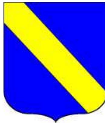
Arma Fauzone: d'azzurro, alla banda d'oro

A volte gli eventi procedono come una strada a senso unico, senza ritorno: discutibili per alcuni o comprensibili per altri, ma una via d'uscita, seppur attraverso metodi non condivisibili o dal fascino antico, esiste oggi come allora.