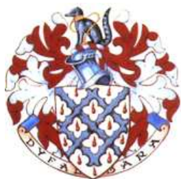
L'arma di Sir Peter (con l'elmo di un semplice esquire o gentiluomo)

Nato nel 1940 proveniente da una famiglia di militari, laureatosi in storia al Trinity College, Cambridge nel 1970 divenne un assistente del allora Garther King of Arms Sir Anthony Wagner. Nel 1973 Gwynn-Jones ebbe il suo primo incarico come aspirante araldo sotto il titolo di Blue-mantle Pursuivant of Arms in Ordinary ; nel 1982 fu promosso Lancaster Herald of Arms , incarico che tenne sino al 1995 quando prese il posto di Sir Conrad Swan come Garther King of Arms , ufficio che egli resse sino a quando non si ritirò dal servizio attivo di araldo nel 2010. Sir Peter sarà ricordato soprattutto per aver portato l'araldica inglese in una nuova epoca con dei disegni semplici nitidi, non senza una certa audacia, che si ispiravano molto a disegni geometrici o con un ampio uso di fauna e flora.