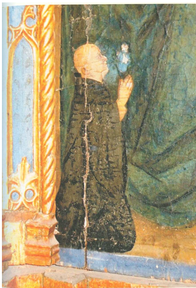
Giovanni in adorazione della Beata Vergine (particolare del pentittico alla Matrice vecchia)

prima la regina Bianca (moglie di Martino I designata quale viceregina durante il regno di Martino II) durante la lunga lotta con Bernardo Cabrera, maestro giustiziere che si riteneva -pur non avendone avuta investitura diretta vicario del re-, poi di Ferdinando de Antequera designato a succedere sul trono d'Aragona e Sicilia nel 1415 e quindi di suo figlio Alfonso il Magnanimo e dei suoi successori a Napoli e in Sicilia.