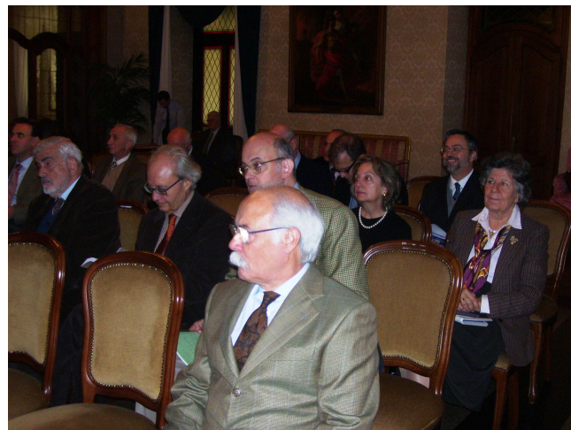
Parte della platea