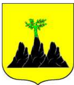
Arma d'Isasca: D'oro all'alloro di verde, fruttato di rosso, nudrito della vetta di mezzo, più alta, di un monte di tre cime, di nero