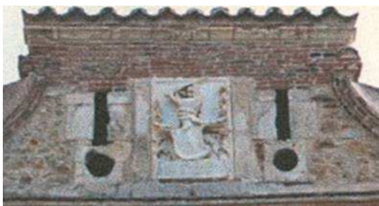
Lo stemma Ventimiglia sul castello di Castelbuono

Fra il 1452 e il 1454 prese parte alle operazioni dell'alleanza veneto-napoletana contro Francesco Sforza divenuto duca di Milano, e da parte del suo sovrano firmò la pace di Lodi che realizzava in quel momento l'equilibrio fra i maggiori stati italiani.