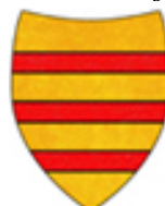
CLEMENTE V (DE GOTH)