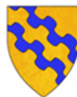
BONIFACIO VIII (CAETANI)