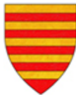
AVOGADRO DI VERCELLI

Gli armati del vescovo di Biella, al comando di Oberto Marchisio, avevano occupato frattanto Mosso.