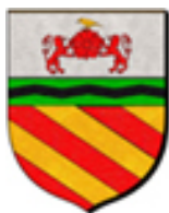
ONORIO IV (SAVELLI)

Tali condanne trovarono conferma da Onorio IV, con la bolla "Olim felicis recordationis", da Niccolò IV, da Bonifacio VIII, da Benedetto XI e da Clemente V, che fulminarono la setta con le loro scomuniche.