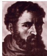
DOLCINO, RITRATTO FANTASTICO SEC. XIX

La maggioranza degli autori concorda nel dargli natali più che onorevoli, giacché lo crede membro della antica ed illustre famiglia Tornielli di Novara.