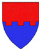
GREGORIO X (VISCONTI DI PIACENZA)

Tali condanne trovarono conferma da Onorio IV, con la bolla "Olim felicis recordationis", da Niccolò IV, da Bonifacio VIII, da Benedetto XI e da Clemente V, che fulminarono la setta con le loro scomuniche.