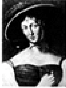
MARGHERITA, RITRATTO FANTASTICO SEC. XIX

Ma la tregua ebbe breve durata e tre degli Apostolici finirono sul rogo. Allora Dolcino, seguito da Margherita e da un gruppo di fedelissimi, tremila al massimo, decise di fare ritorno in Valsesia.