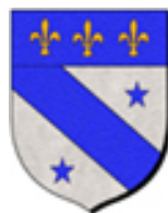
NICCOLÒ IV (MASCÌ)