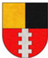
BENEDETTO XI (BOCCASINI)