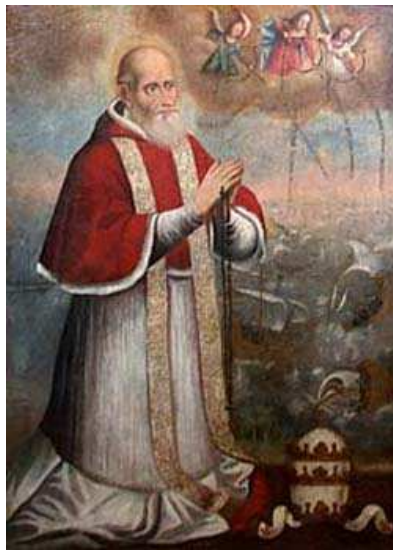
PAPA PIO V

A Roma nel XVI secolo non era praticata quella netta separazione tra ceti nobile e popolo, così come accadeva, invece, in quasi tutte le realtà comunali italiane nelle quali, al contrario, l'aristocrazia del comune (patriziati o decurionati che fossero) era rigidamente separata dagli altri ceti ed, in cui, le cariche cittadine, rispecchiavano gerarchicamente ruoli sociali; quivi, tutto ciò che concerneva il regime dei privilegi, era riferibile alla concessione della sola cittadinanza romana .