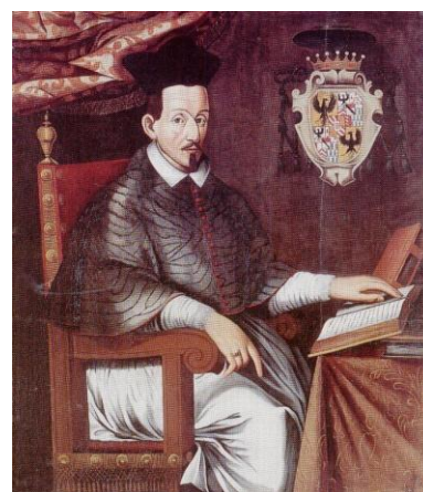
Carlo Emanuele Madruzzo

però dalla monocromia dell'incisione al colore del ritratto, nell'arma del principe vescovo sono stati commessi vari errori di smalti: il principale è forse il fondo d'oro del 1° e 4° quarto, quasi come se si volesse rappresentare l'aquila di Savoia antica. Anche Valangin, Bauffremont e Portogallo hanno smalti sbagliati.