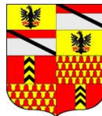
Challant a Issogne

La prima è quella presente 5 nel cortile del castello di Issogne, il "Miroeyr pour les Enfens de Challant": troncato, al 1° inquartato, d'oro all'aquila di nero (vicecomitato di Aosta) e di Challant, al 2° inquartato di Valangin e di Bauffremont.