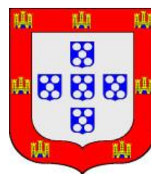
arma di Portogallo

La ripetizione dell'errore, se di errore si tratta, potrebbe essere dovuta a una banale derivazione di una versione dall'altra. L'errore sembrerebbe comunque incomprensibile dal momento che, come osservato in precedenza, nell'arma del ritratto di Saint-Gilles, la partizione di Portogallo è rappresentata nel modo corretto, pur con gli smalti sbagliati.