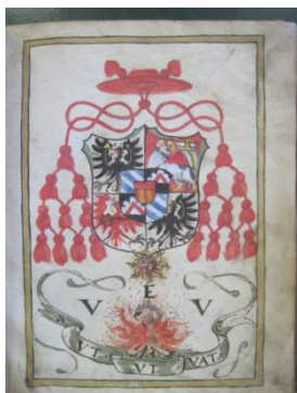
arma Cristoforo Madruzzo

A sinistra una delle armi del cardinale Cristoforo inquartato, al 1° e 4° di Trento, al 2° e 3° del capitolo e vescovado di Bressanone, sul tutto di Madruzzo moderno (nella variante di rosso a due pali d'oro, con il capo di rosso).