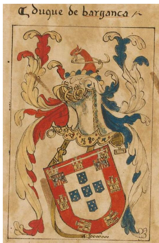
cod. 290, Alte Hofbibliothek di Monaco

Tra le numerosissime varianti delle armi ducali, finalmente compare lo stemma con il lambello d'argento, a tre pendenti, quelli esterni carichi di un quadretto partito di Aragona e di Sicilia-Aragona.