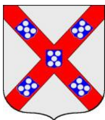
arma antica di Braganza

Bisogna però notare che Mencia 14 , moglie di Renato, appartiene alla casa dei duchi di Braganza 15 : ho dunque cercato se questa celebre famiglia portoghese abbia avuto, prima dell'ascesa al trono di Portogallo (1640), un'arma che possa ricordare quella rappresentata nei tre stemmi di Carlo Emanuele.