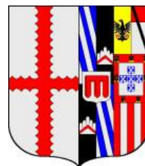
arma di Carlotta

L'arma di Carlotta ( partito, al 1° di Madruzzo moderno, al 2° interzato in fascia, a) partito del vicecomitato di Aosta e di Challant, b) di Portogallo, c) di rosso, a due pali d'argento ) è partita con quella del marito Carlo di Lenoncourt ( d'argento, alla croce scanalata di rosso ). Nel punto b) è chiaramente raffigurata l'arma di Portogallo.