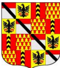
Challant in "Chronologies"

La seconda è quella data da Jean-Baptiste de Tillier nel "Nobiliaire du Duché d'Aoste". È sostanzialmente uguale alla precedente 6 , tranne il 1° punto del troncato, i cui quarti sono scambiati (Challant al posto del vicecomitato di Aosta e viceversa).