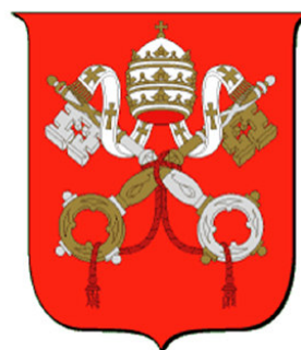
Stemma della S. Sede