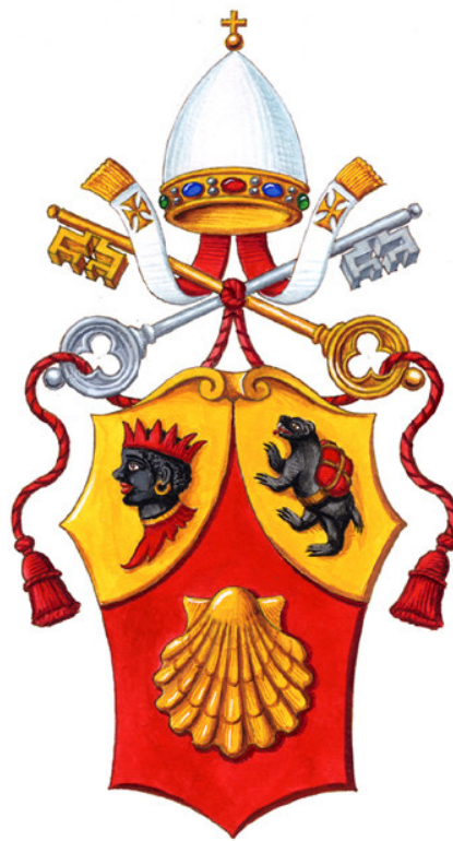
Stemma di S.S. Benedetto XVI con tiara antica (disegno di Maurizio Bettoja)

distinzione già esisteva, ed era perfettamente rappresentato da oltre un millennio dalla tiara, l'ornamento da sempre portato dal Papa, allora perché cambiarlo? E se erano le corone a causare tanta costernazione, allora perché non ritornare alla tiara originaria, col solo cerchio gemmato alla base? Esempi di stemmi Papali timbrati da tiare con una sola corona non sono mancati anche in età moderna: si potrebbe citare ad esempio una bella xilografia, raffigurante l'arma di Papa Pio IV, con una tiara con una sola corona alla base. Nella mitria a strisce si è così conservato il ricordo di ciò che era accessorio, scartando l'essenziale.