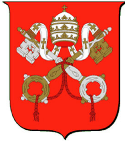
Stemma della S. Sede

Solo verso la metà del XIV sec. le chiavi appaiono combinate – e non semplicemente accostate - con la tiara nelle armi Papali: fra i primi esempi, lo stemma di Clemente VI posto sopra la porta del palazzo Papale di Avignone (1348), e le armi di Innocenzo VI sulla tomba del vescovo Baldracco Malabaila nel Duomo di Asti (1353), anche se le chiavi, quali emblema della Chiesa, erano accostate allo stemma Papale già con Bonifacio VIII.