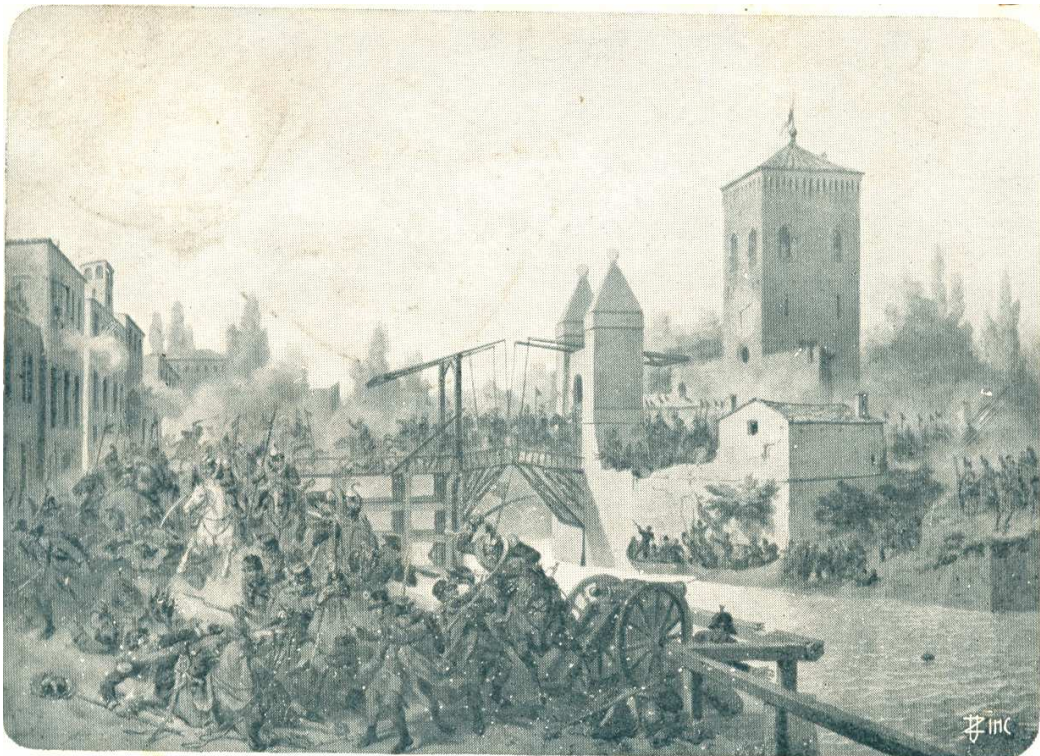
Genova Cavalleria a Governolo il 18 luglio 1848

La storia di questa guerra è piena di episodi di valore ma si tratta di piccoli scontri, che impegnarono in genere solo plotoni, quelli che videro impiegati più cavalieri furono i combattimenti del 30 maggio a Goito e del 18 luglio a Governolo, ove Genova caricò con tre squadroni