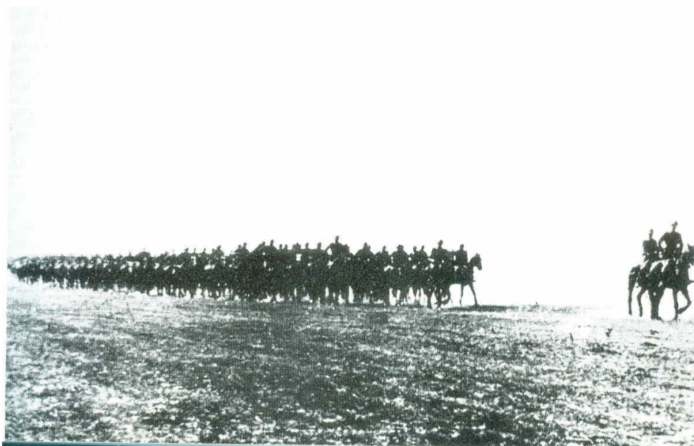
Lancieri di Novara in Russia – Settembre 1942

Così l'Arma partecipò alla seconda guerra mondiale con assoluta maggioranza di unità a cavallo, con le quali scrisse pagine di straordinario valore, ma vi è da chiedersi cosa avrebbe potuto fare se fosse stata armata in modo da combattere alla pari con l'avversario. Le divisioni celeri 2 entrarono in guerra con 2154 quadrupedi e 61 carri L e nessuna autoblindo, la cui produzione iniziò solo nel 1940.